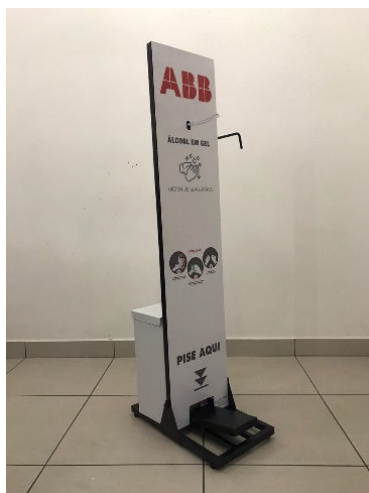
Totem Slim 5 Litros