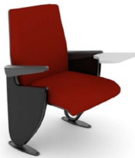
FLEXIBASE / SONATA

moldada anatomicamente a quente com pressão de no mínimo 10 Kgf/cm², com espessura mínima de 12mm. Utilizando lâminas de florestas renováveis e sustentáveis com alto grau de dureza e espessura máxima de 2 mm, intercaladas sempre em número ímpar, com cola cascarnite a base de ureia formol de baixa emissão. Capa de proteção e acabamento injetada/moldada em polipropileno texturizado, com bordas arredondadas, sem uso do perfil de PVC. As estruturas do assento e do encosto devem receber porcas e parafusos auto atarraxantes para a montagem e instalação dos mecanismos, garantindo uma perfeita fixação dos componentes. Para a fixação de componentes que sofrerão esforços físicos, devido aos movimentos dos mecanismos, além da porca com garra, será utilizado em conjunto trava química no momento da colocação dos parafusos, evitando o afrouxamento dos mesmos, bem como evitando o surgimento de ruídos indesejáveis, decorrentes do uso. A fixação das capas de proteção será por meio de parafusos cabeça chata e flangeada embutidos em cavidades apropriadas, não ultrapassando a superfície da blindagem. O estofamento deverá ser em espuma injetada, com alta pressão, de poliuretano flexível, isento de CFC (clorofluorcarbureto), isocianato 100%